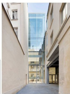
Crédit photo : Vue de la tour d'exposition depuis le passage rue Sainte-Croix-de-la-Bretonnerie © Martin Argyroglo

Depuis son ouverture le 10 mars 2018, la Fondation est le premier centre multidisciplinaire de ce type en France. Dans son bâtiment du XIX e siècle situé au cœur du Marais et rénové par Rem Koolhaas et l'agence d'architecture OMA, le public découvre de nouvelles pièces produites par des créateurs internationaux issues des domaines de l'art contemporain, du design et de la mode.